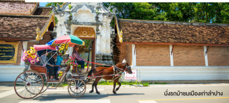
นั่งรถม้าชมเมืองเก่าลำปาง