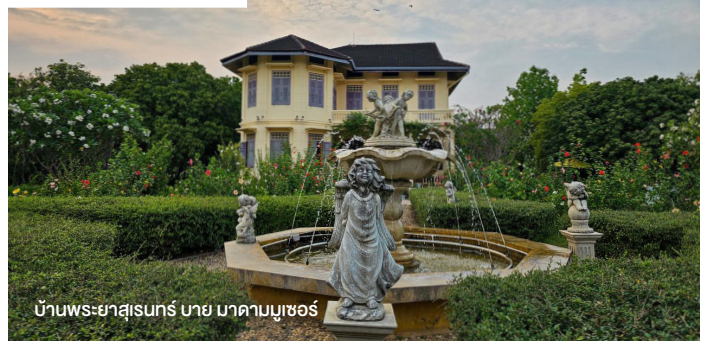
บ้านพระยาสุเรนทร์ บาย มาดามมูเซอร์

จากนั้นนั่งรถม้าต่อไปยัง วัดปงสนุก แห่ง เขลางค์นคร ธรรมสถานหนึ่งเดียวของไทยที่ได้รับ รางวัล “Award of Merit” จาก UNESCO ใน พ.ศ. 2551 เผยเส้นทางการอนุรักษ์ศิลปวัฒนธรรม และสถาปัตยกรรมเก่าแก่ที่เหลืออยู่เพียงแห่งเดียว ในประเทศไทย (นั่งรถม้าไป 2 จุด บ้านหลุยส์ฯ และวัดปงสนุกใช้เวลาทั้งหมด 30 นาที)