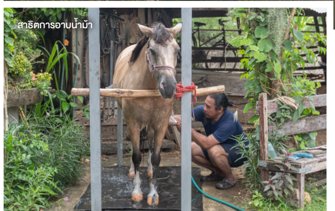
สาธิตการอาบน้ำม้า