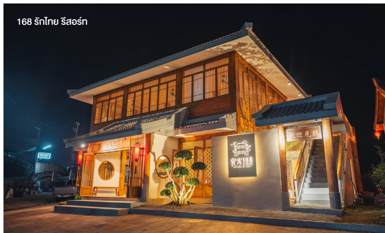
168 รักไทย รีสอร์ท

เยี่ยมชมมรดกศรัทธาแห่งลำปาง หรือ “เวลายาคันคร” ที่มีประวัติศาสตร์ยาวนานและน่าสนใจ ทั้งวัดโบราณศิลปะล้านนาและไทใหญ่ มรดกภูมิปัญญาด้านงานช่างหัตถศิลป์ ไม่ว่าจะเป็นหัตถศิลป์พื้นบ้านหรืองานช่างพุทธศิลป์ ซึ่งล้วนสะท้อนความผูกพันของผู้นับและวิถีชีวิต