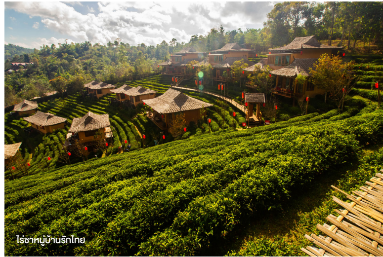
ไร่ชาหมู่บ้านรักไทย

สัมผัสความสวยงามใน หมู่บ้านรักไทย ซึ่งประชากรส่วนใหญ่เป็นชาวจีนยูนนานหรือจีนฮ่อ ซึ่งยังคงสืบทอดประเพณี วัฒนธรรม และวิถีชีวิตตามแบบชาวจีนยูนนานไว้เช่นเดิมไม่เปลี่ยนแปลง เพลิดเพลินตามอัธยาศัยกับการถ่ายภาพความงดงามของไร่ชา ท่ามกลางบรรยากาศที่พักอาศัยแบบบ้านดิน พร้อมดื่มชิมชาเลิศรสที่ชงจากชาพันธุ์ดี ซึ่งมีจำหน่ายในหมู่บ้าน เช่น ชาชิงชิง ชาอู่หลง ชาโสม ชามะลิ รวมถึงของฝากต่าง ๆ เช่น ผลไม้เมืองหนาวแช่แข็ง ของที่ระลึกพื้นเมือง ฯลฯ