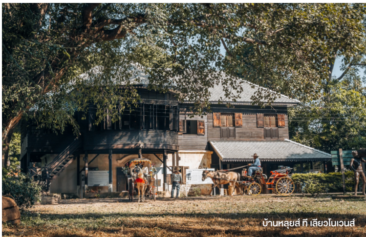
บ้านหลุยส์ ที เลียวโนเวนส์

ช่วงเช้า รับประทานอาหารเช้า ณ ห้องอาหารของโรงแรม เดินทางสู่ ชุมชนท่ามะโอ ชุมชนอันเก่าแก่ของเมืองลำปาง นำชม บ้านม้าท่าหน้า แหล่งเรียนรู้วิถีชีวิตคนเลี้ยงม้า ชมสาธิตการอาบน้ำม้า สาธิตการตีเกือกม้า โดยช่างตีเกือกม้าลากรถคนสุดท้ายของจังหวัดลำปาง จากนั้นพาทำนั้งรถม้าชมเมืองเก่าลำปาง (นั่งคันละ 2 ท่าน) เยือน บ้านหลุยส์ ที เลียวโนเวนส์ คฤหาสน์เก่าแก่อายุเกือบ 120 ปีในจังหวัดลำปางที่เคยเป็นบ้านของนายห้างค้าไม้ชาวอังกฤษนามว่า หลุยส์ ที. เลียวโนเวนส์ ลูกชายของหม่อมแอนนา เลียวโนเวนส์ ครูสอนภาษาอังกฤษในราชสำนัก สมัยพระบาทสมเด็จพระจอมเกล้าเจ้าอยู่หัว (บริการเบรคชมพื้นที่เมือง พร้อมเครื่องดื่ม)