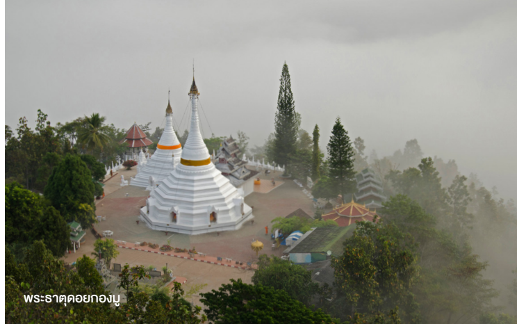
พระธาตุคอกยงมู