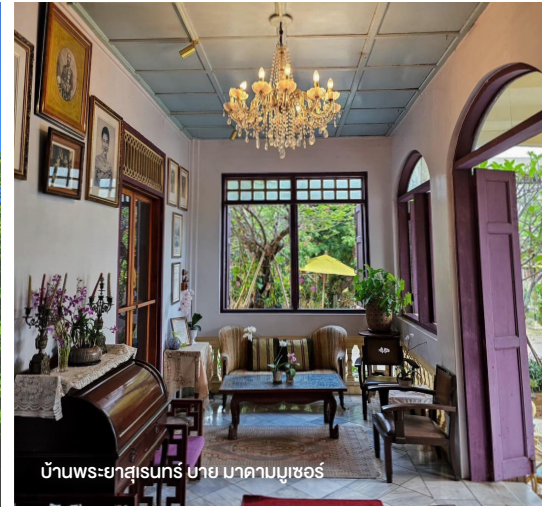
บ้านพระยาสุเรนทร์ บาย มาดามมูเซอร์