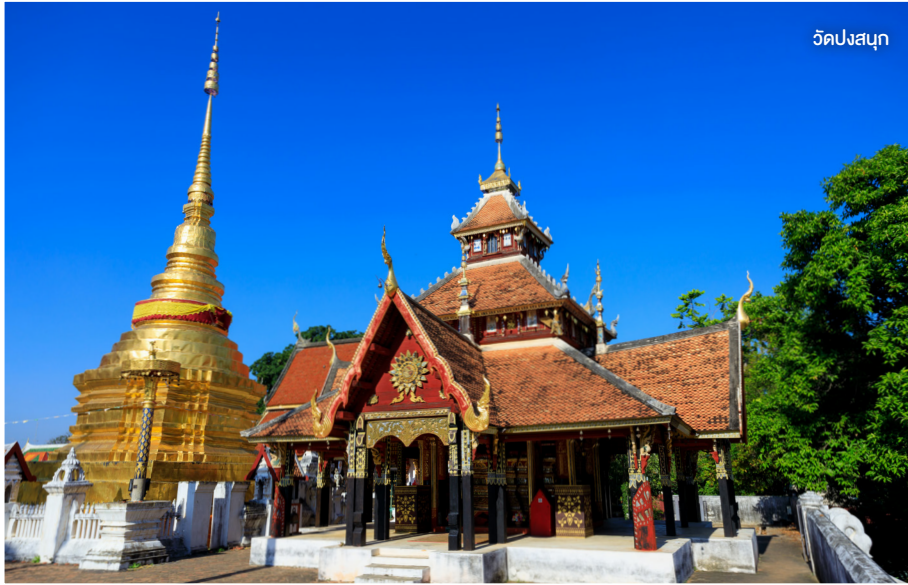
วัดปงสนุก