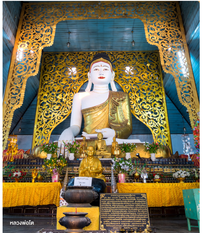
วัดจองคำและวัดจองกลาง

เที่ยง รับประทานอาหารกลางวัน ณ ร้านบ้านนินตรา (อาหารเวียดนาม)