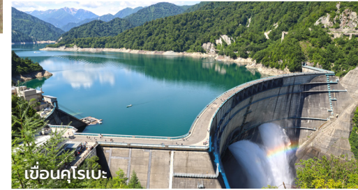
เขื่อนคุโรเบะ