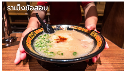
ราเม็งข้อสอบ

รับประทานอาหารค่ำ ณ ภัตตาคารราเม็งข้อสอบ สูดยอดราเม็งระดับท็อปร้านนี้ไม่สามารถจองล่วงหน้าได้ ดังนั้นทีมงานจะคอยบริการอยู่หน้าร้าน เพื่อแนะนำการเลือกรับประทานสูดยอดราเม็งข้อสอบรสชาติที่ต้องการ