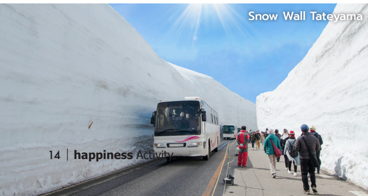
Snow Wall Tateyama

รับประทานอาหารเช้า นำเข้าที่พักโรงแรม Yatsugatake Royal Hotel หรือเทียบเท่า (4 ดาว)