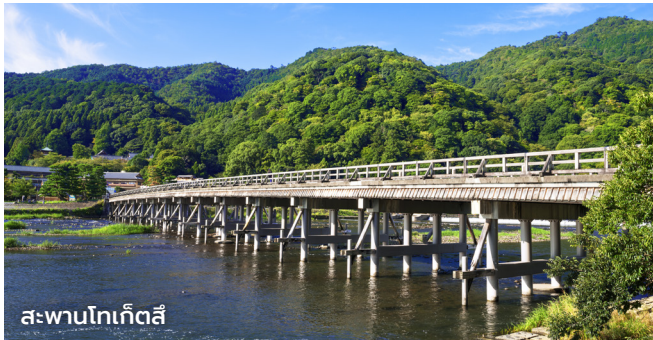
สะพานโทเก็ตสึ