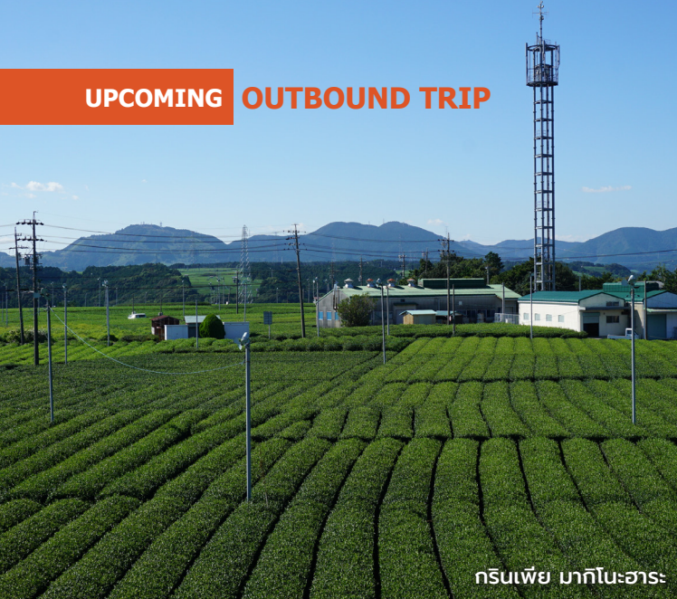
กรีนเปีย มาकिनะฮาระ