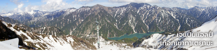
เจแปนแอลป์ เทือกเขากาเตยามะ