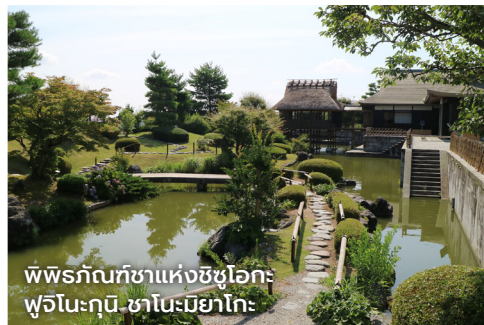
พิพิธภัณฑ์ชาแห่งชิซูโอกะ: ฟูจิโนะกุนิ ชาโนะมียาโกะ