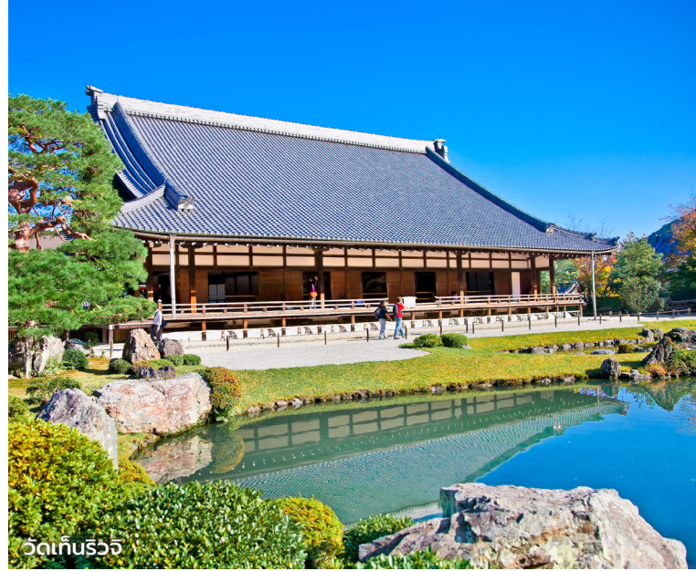
วัดเกินร่วจ