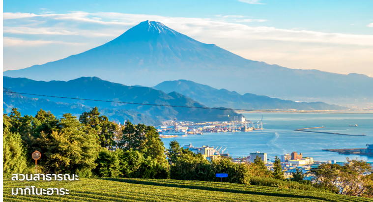
สวนสาธารณะ: มาคิโนะฮาระ