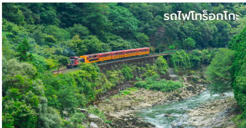
รถไฟโทริโอกะ