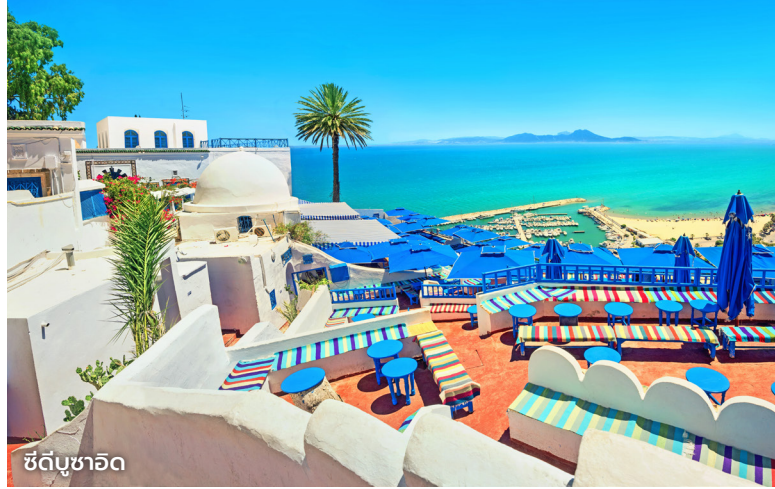
ซิดิบูซาอิด

ช่วงบ่าย เยือน พิพิธภัณฑน์บาร์โด (Bardo) สร้างขึ้นในคริสต์ศตวรรษที่ 13 อดีตเป็นพระราชวังเก่าของเบย์ (bey) หรือเจ้าผู้ครองนคร ที่ไม่เพียงสะท้อนความงามของสถาปัตยกรรมอาหรับ แต่ยังเป็นแหล่งศึกษาประวัติศาสตร์จากยุคกรีก-โรมัน สู่ยุคไบแซนไทน์ จนถึงยุคอิสลาม ตลอดจนวิถีชีวิตของชาวตูนิเซีย ผ่านโบราณวัตถุโดยเฉพะงานแกะสลักหิน และโรมันโมเสกที่มีขนาดใหญ่ที่สุด สวยที่สุด และสมบูรณ์ที่สุดในโลก