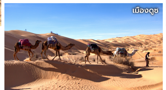
เมืองดูซ