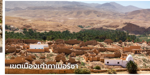
เขตเมืองเก่ากาเบอร์ซา