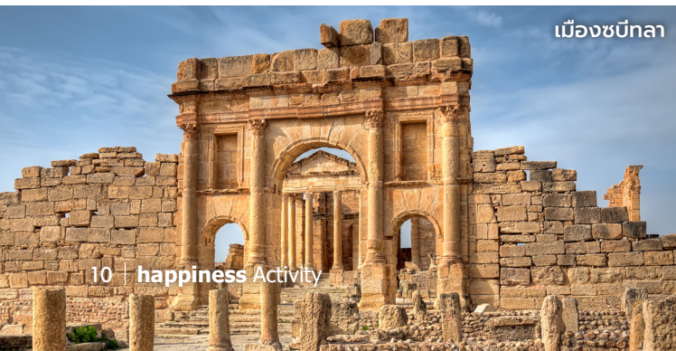
เมืองเซบิกา

เยือน ทาเมอร์ซา (Tamerza) โอเอซิสขนาดใหญ่ที่สุด เต็มไปด้วยแนวหุบเขาลึกตระการตา โดดเด่นด้วยหินผาสีอมชมพู อีกทั้งมีน้ำตกสองสายไหลลงสู่ธารน้ำขนาดใหญ่ บริเวณเชิงเขารอบนอกเป็นเขตเมืองเก่าทาเมอร์ซา ซึ่งยังหลงเหลือหุบผาคารอิซยุคดั้งเดิมของชาวเมืองเขตทะเลทรายให้เห็น ปิดท้ายด้วย