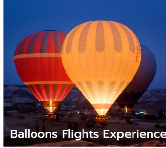
Balloons Flights Experience

รับประทานอาหารเช้า ณ ห้องอาหารของโรงแรม ฟอนคาลัยในเมืองตากอากาศริมทะเลเมดิเตอร์เรเนียน ที่มีหาดทรายนุ่มเนียนเท้า เหมาะแก่การมาเดินเล่น ชมทะเลสีฟ้าครามส่งประกายระยิบระยับ มองเห็นเรือประมงสีสดล่องอยู่ลิบ ๆ แถวนั้นมีที่พักหลายระดับ โดยเฉพาะวิลลาและรีสอร์ทที่นิยมสร้างแบบปูนเปลือย สีขาวสะอาดตา รายล้อมด้วยสวนและพืชพรรณนานาชนิดโดยเฉพาะต้นแฉสมิน (ลักษณะคล้ายพุทธรักษาและมะลิ) จึงนำมาใช้เรียกย่านที่พักสำหรับนักท่องเที่ยวว่า “แฉสมินแอมมาเมต” และมีของที่ระลึกทำจากแฉสมินซึ่งพบเห็นได้ทั่วไปด้วย จากนั้นออกเดินทางสู่ กรุงตูนิส (Tunis) (ใช้เวลาเดินทางประมาณ 1 ชั่วโมง) เมืองหลวงและเมืองที่ใหญ่ที่สุดของประเทศตูนิเซีย ตั้งอยู่ในเขตอ่าวตูนิส ริมฝั่งทะเลเมดิเตอร์เรเนียน ในอดีตเป็นพื้นที่อยู่อาศัยของอาณาจักรโรมัน “ตูนิส” แปลว่า “แหลม” ในภาษาเบอร์เบอร์ ซึ่งเรียกตามสภาพภูมิประเทศที่เป็นลักษณะแหลมยื่นเข้าไปในทะเล บรรยากาศเมืองจึงค่อนข้างสบาย ๆ ปัจจุบันเป็นเมืองที่เต็มไปด้วยสิ่งอำนวยความสะดวก ทั้งโรงแรมที่พัก ซุปเปอร์มาร์เก็ต ร้านอาหาร และการคมนาคมขนส่ง