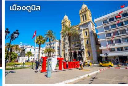
เมืองตูนิส