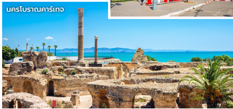
นครโบราณคาร์เทจ