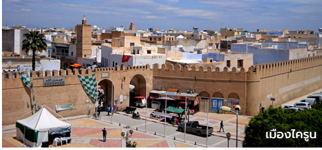
เมืองไครูน