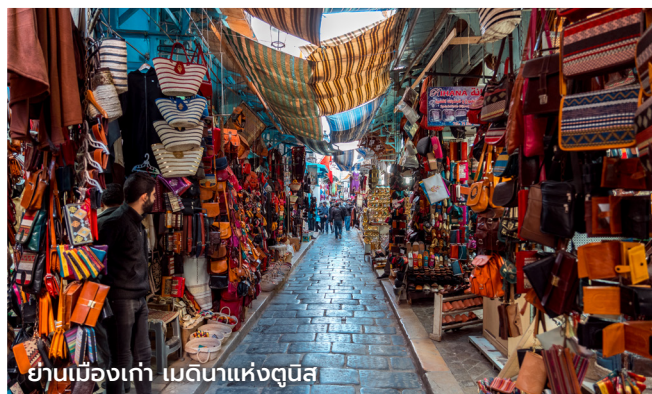
ย่านเมืองเก่า เมดนาแห่งตุงบิส