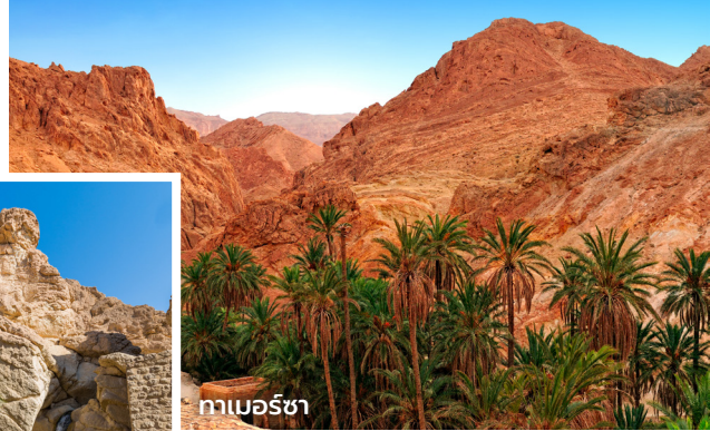
กาเบอร์ซา

รับประทานอาหารค่ำ ณ ห้องอาหารของโรงแรม นำเข้าที่พัก Hotel Anantara Zahara Tozeur Resort ***** หรือเทียบเท่า (2 คืน)