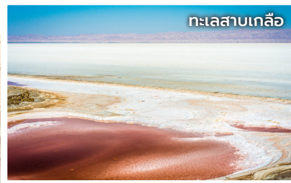
ทะเลสาบเกลือ