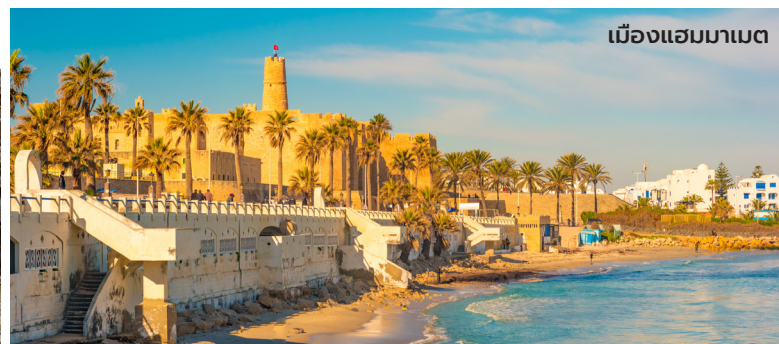
เมืองแอมมาเมต

รับประทานอาหารค่ำ ณ ห้องอาหาร L'Onzieme Grill Restaurant ของโรงแรม นำเข้าที่พัก Hotel Marriott Tunis ***** หรือเทียบเท่า (พัก 2 คืน)