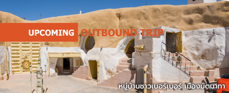
หมู่บ้านชาวเบอร์เบอร์ เมืองมัตมก้า