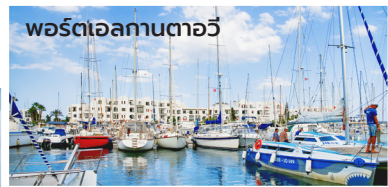
พอร์ตเอลกันทาวี