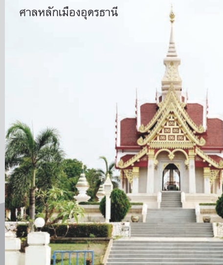
ศาลหลักเมืองอุดรธานี

เริ่มต้นปีใหม่ด้วย เส้นทางสายบุญ โดยการเดินทาง ไปสักการะวัดเก่าแก่แดนอีสาน จ.อุดรธานี ข้ามสะพานมิตรภาพไทย - ลาว ไปสัมผัสอารยธรรมเพื่อนบ้าน เมืองเวียงจันทน์ ประเทศลาว เพลิดเพลินกับสินค้าตลาดอินโดจีน “ท่าเสด็จ” จ.หนองคาย ชมสถานที่ท่องเที่ยว Unseen Thailand พุทธสถานท่ามกลางธรรมชาติ วัดป่าภูก้อนตั้งอยู่ในเขตป่าสงวนแห่งชาติ รอยต่อแผ่นดิน 3 จังหวัด คือ อุดรธานี เลย และหนองคาย แวะชมแวะซื้อความงามของผ้าไหมมัดหมี่และผ้าไหมขึ้นชื่อแห่งบ้านนาข่า อิ่มอร่อยกับความหลากหลายของอาหารท้องถิ่น ทั้งไทยอีสาน และอาหารเวียดนาม “ແໜມເນືອງ” อันขึ้นชื่อ