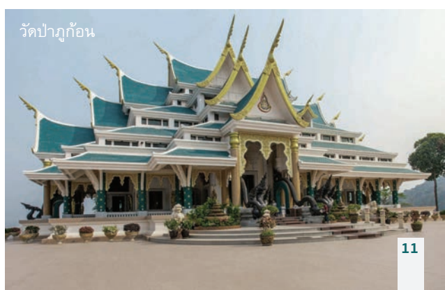
วัดป่าภูก้อน