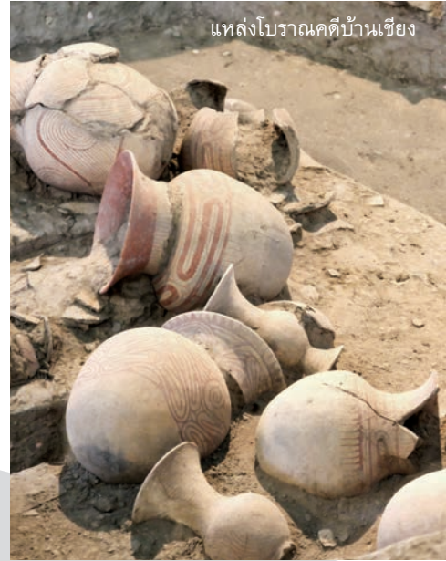
แหล่งโบราณคดีบ้านเชียง

รับประทานอาหารเช้าที่โรงแรม เช็กเอาท์ และนำท่านเที่ยวชม แหล่งโบราณคดีบ้านเชียง เมืองเก่ามรดกโลก เป็นแหล่งโบราณคดีสำคัญ ได้ชื่อว่าเป็นถิ่นฐานยุคก่อนประวัติศาสตร์ที่สำคัญที่ค้นพบในเอเชียตะวันออกเฉียงใต้ รวมทั้งแสดงหลักฐานของการเกษตรกรรม แหล่งผลิตและการใช้โลหะในภูมิภาค ทำให้รับรู้ถึงการดำรงชีวิตในสมัยก่อนประวัติศาสตร์ ย้อนหลังไปกว่า 4,300 ปี และนำท่านนั่งรถรางชมวิถีชีวิต ที่อยู่อาศัยของคนลาวพวน และชมวิถีการทำผ้าย้อมคราม และชมการเขียนลายลงไหบ้านเชียง