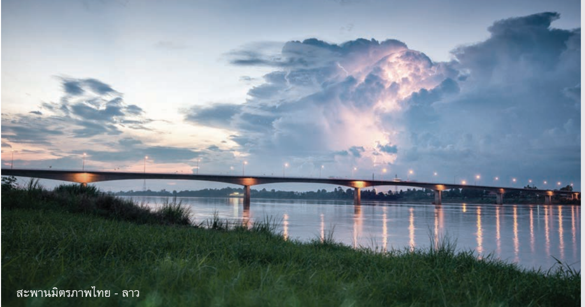
สะพานมิตรภาพไทย - ลาว