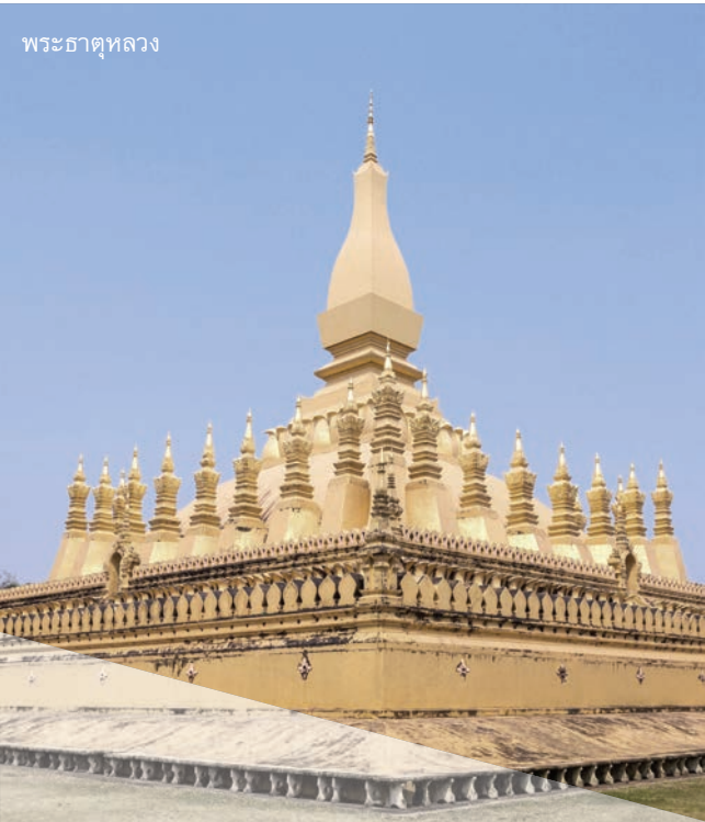
พระธาตุหลวง