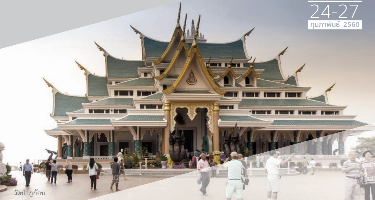
วัดป่าภูก้อน

เริ่มต้นปีใหม่ด้วย เส้นทางสายบุญ โดยการเดินทาง ไปสักการะวัดเก่าแก่แดนอีสาน จ.อุดรธานี ข้ามสะพานมิตรภาพไทย - ลาว ไปสัมผัสอารยธรรมเพื่อนบ้าน เมืองเวียงจันทน์ ประเทศลาว เพลิดเพลินกับสินค้าตลาดอินโดจีน “ท่าเสด็จ” จ.หนองคาย ชมสถานที่ท่องเที่ยว Unseen Thailand พุทธสถานท่ามกลางธรรมชาติ วัดป่าภูก้อนตั้งอยู่ในเขตป่าสงวนแห่งชาติ รอยต่อแผ่นดิน 3 จังหวัด คือ อุดรธานี เลย และหนองคาย แวะชมแวะซื้อความงามของผ้าไหมมัดหมี่และผ้าไหมขึ้นชื่อแห่งบ้านนาข่า อิ่มอร่อยกับความหลากหลายของอาหารท้องถิ่น ทั้งไทยอีสาน และอาหารเวียดนาม “ແໜມເນືອງ” อันขึ้นชื่อ