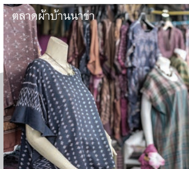
ตลาดผ้าบ้านนาข้าว