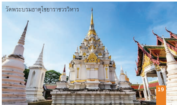
วัดพระบรมธาตุไชยาราชวรวิหาร