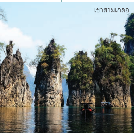
เขาสามเกลอ