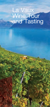
La Vaux Wine Tour and Tasting