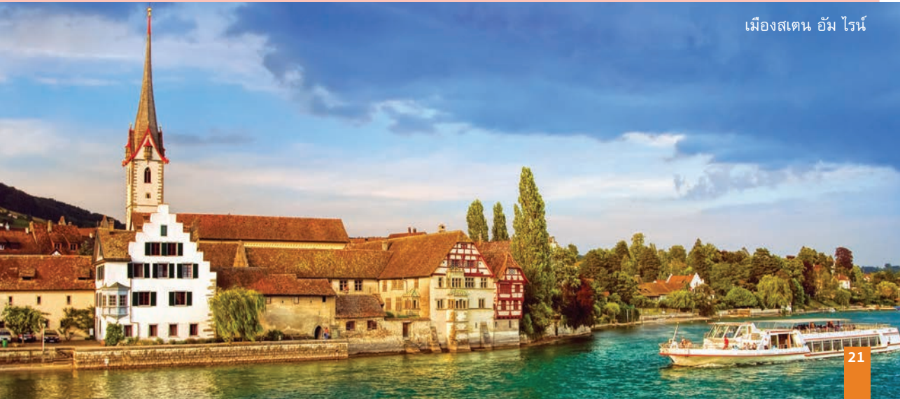
เมืองสแตน อัม ไรน์