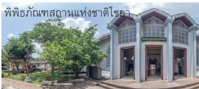
พิพิธภัณฑสถานแห่งชาติไชยา