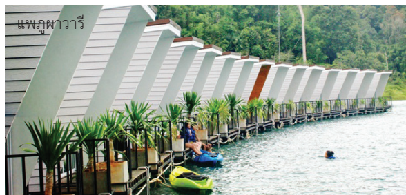
แพภูพาวารี