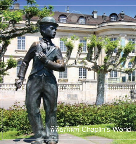
พิพิธภัณฑ์ Chaplin's World

ช่วงบ่าย นั่งรถไฟ Golden Pass หนึ่งในทางรถไฟที่สวยงามที่สุดของสวิตเซอร์แลนด์ จากเมือง มงเทรอก (Montreux) สู่มือง สวาซิเมน (Zweisimmen) ระหว่างทางผ่านภูมิประเทศที่สวยงาม ทั้งภูเขา และ ทะเลสาบ ที่เป็นเอกลักษณ์ของสวิตเซอร์แลนด์ รถไฟขบวนนี้มีความพิเศษตรงขนาดของหน้าต่างที่ใหญ่ เพื่ออรรถรสในการรับชมวิว และง่ายต่อการถ่ายภาพไว้เป็นที่ระลึก เดินทางสู่ เมืองทูน (Thun) ช่วงค่ำ รับประทานอาหารเย็น เข้าสู่ที่พักโรงแรม Congress Hotel Seepark หรือเทียบเท่า