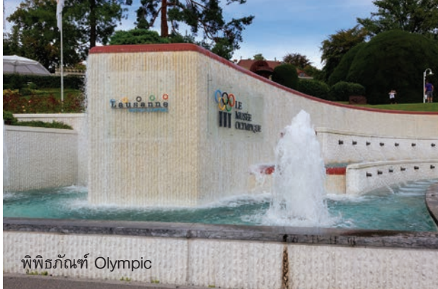
พิพิธภัณฑ์ Olympic