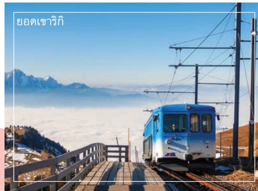
ยอดเขาริกิ