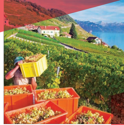
โรงแรม Beau-Rivage Palace Lausanne

รับประทานอาหารเย็น เข้าสู่ที่พักโรงแรม Beau-Rivage Palace Lausanne พักผ่อนตามอัธยาศัย