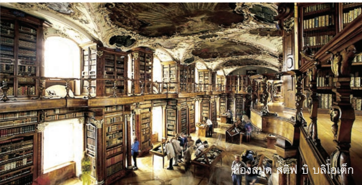
ห้องสมุด สตีฟ บี บิลิโอเด็ก