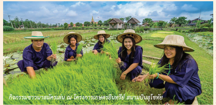
กิจกรรมชวานาสมัครเล่น ณ โครงการเกษตรอินทรีย์ สนามบินสุโขทัย