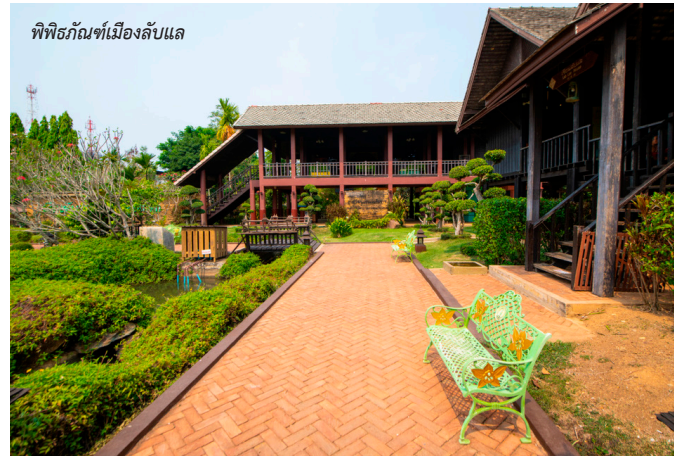
พิพิธภัณฑ์เมืองลับแล