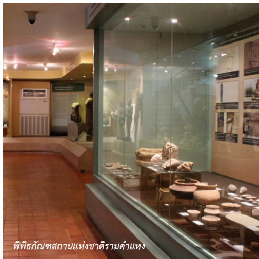
พิพิธภัณฑ์สถานแห่งชาติรามคำแหง