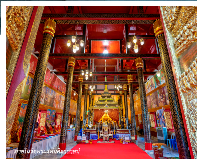
ภายในวัดพระแท่นศิลาอาสน์