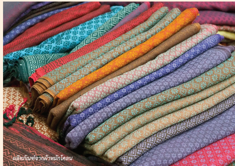
ผลิตภัณฑ์จากผ้าหมักโคลน