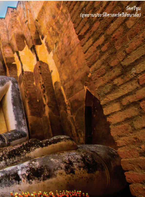
วัดศรีซุน (อุทยานประวัติศาสตร์ศรีสขณาสัย)