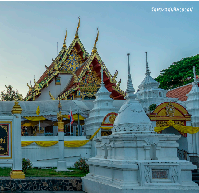
วัดพระแท่นศิลาอาสน์