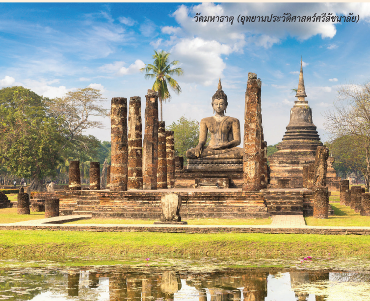
วัดมหาธาตุ (อุทยานประวัติศาสตร์ศรีสัชนาลัย)