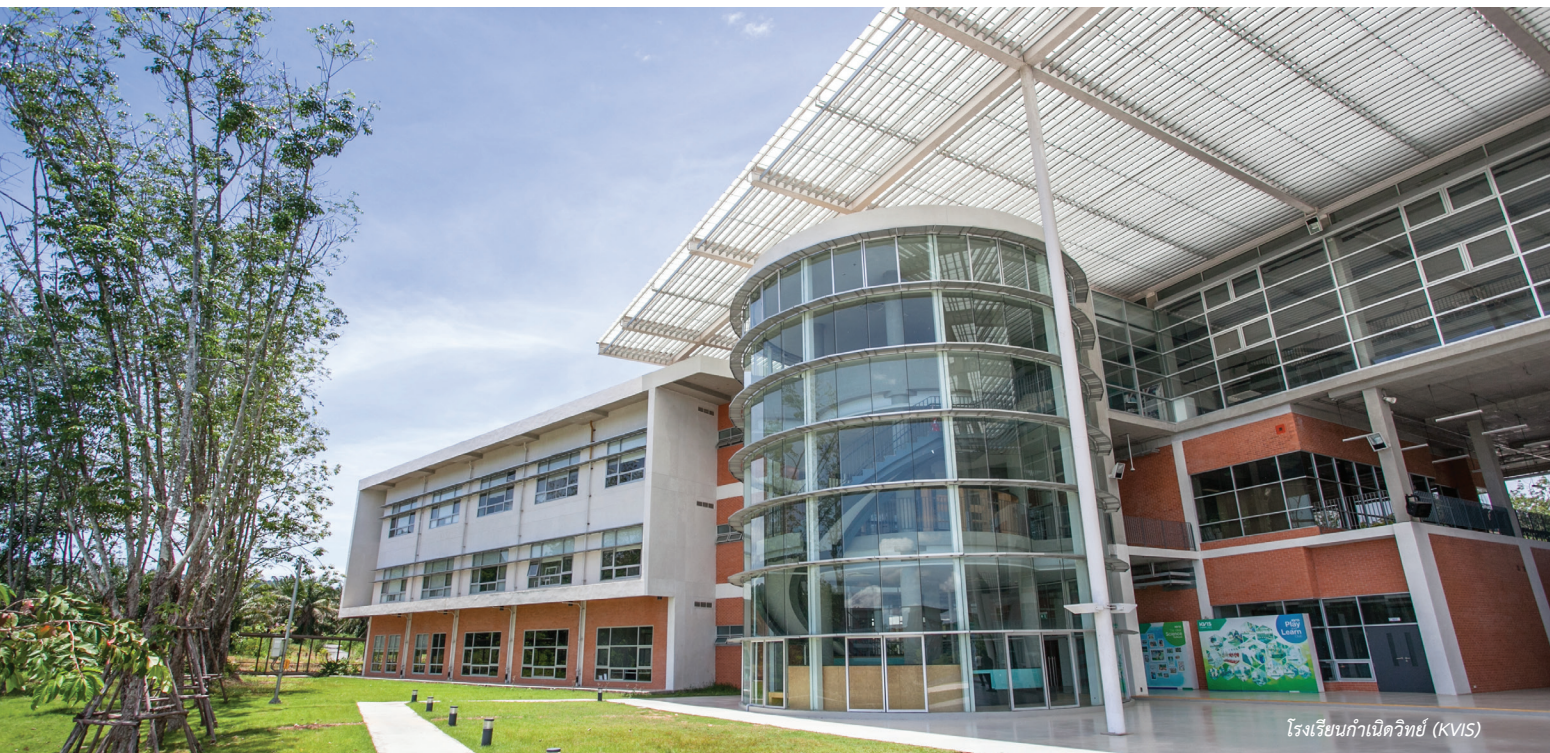
โรงเรียนกำเนิดวิทย์ (KVIS)

กิจกรรมเยี่ยมชมชมกิจการ ปตท. ครั้งที่ 2 ประจำปี 2563