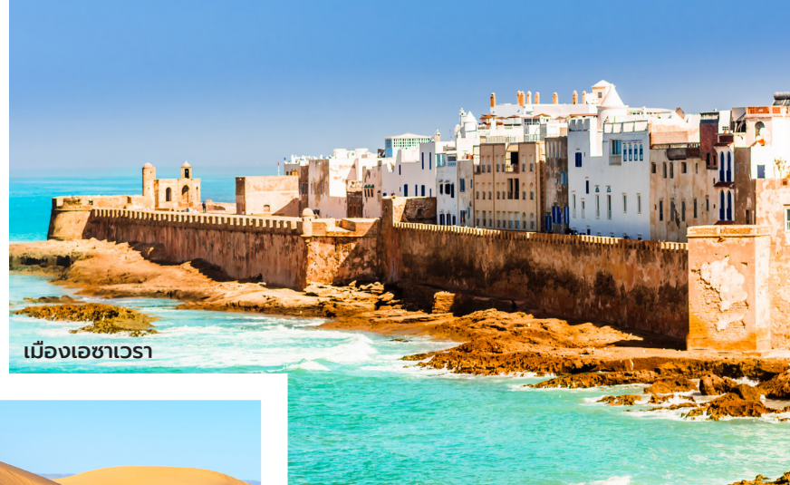
เมืองเอซาเวรา

โมร็อกโกประเทศที่อุดมไปด้วยศิลปะหัตถกรรม สีสันในวิถีชีวิตของผู้คน วัฒนธรรมอันเก่าแก่ อารยธรรมโบราณ และวิวทิวทัศน์แห่งประวัติศาสตร์หน้าตาต่าง ๆ เต็มแต่งให้โมร็อกโกกลมกล่อม มีทั้งรสชาติดีดูเด็ดเผ็ดมันของการผจญภัยในทะเลทรายซาฮารา รสละมุนของมาร์ราเคช เมืองที่ฝรั่งบางคนถึงกับออกปากว่าเป็นหนึ่งในสิบเมืองของโลกนี้ที่ต้องไปเห็นก่อนตาย