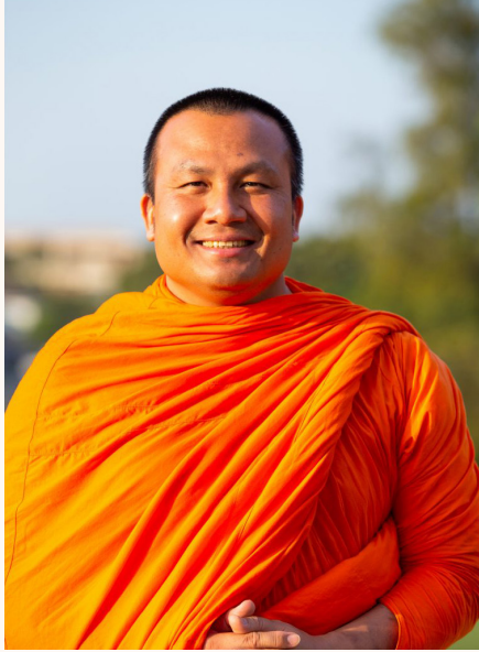
พระมหาสมปอง ตาลปุตฺโต (นครราชสีมา)

พระมหาสมปอง ตาลปุตฺโต (นครราชสีมา) หรือพระมหาสมปองเป็นผู้สร้างแรงบันดาลใจในการฟังธรรมที่สามารถเข้าถึงผู้ฟังได้ทุกเพศทุกวัยผ่านหลายช่องทางการเผยแพร่ธรรมะ ไม่ว่าจะเป็นวีซีดีธรรมะเดลิเวอรี่จำนวน 27 ชุด ผลงานหนังสือ รายการโทรทัศน์และวิทยุ รวมถึงโซเชียลมีเดียที่มีช่องยูทูปของพระมหาสมปอง ตาลปุตฺโต channel, Facebook Fanpage และ TikTok