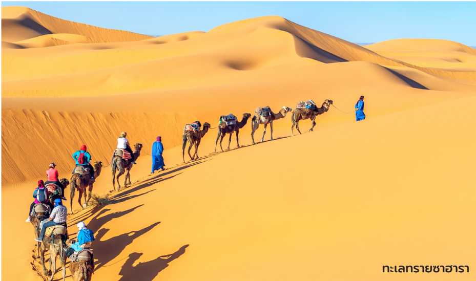
ทะเลทรายซาฮารา