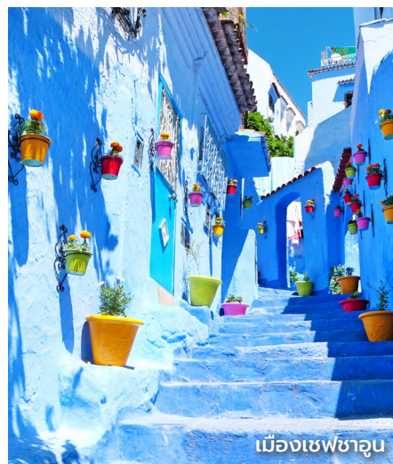
เมืองเซฟซาอู

ยังมีอดีตเมืองหลวงอย่างเฟส ที่จะทำให้ นักเดินทางเที่ยวได้อย่างสดชื่นรื่นใจ แล้วคุณ จะได้สูดตรศณบทใหม่ที่ว่า สิบตลาดจตุจักร เท่ากับหนึ่งตลาดของเฟส